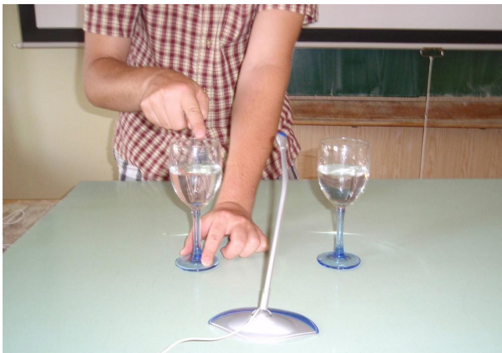
Obr. 43 Demontrace rázů pomocí rezonance skleniček

Dvě sklenice na víno naplníme přibližně z poloviny vodou, přičemž rozdíl hladin v obou sklenicích by měl být přibližně 4 až 5 mm. Sklenice postavíme ve vzdálenosti cca 20 cm od sebe a uprostřed mezi ně umístíme mikrofon, viz obr. 43.