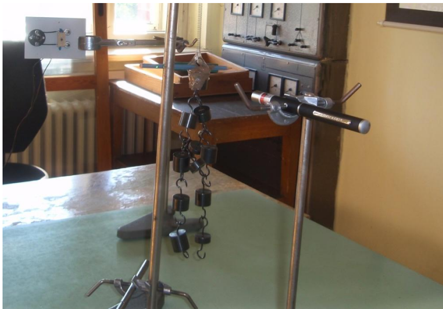
Obr. 35 Pružinový oscilátor – uspořádání experimentu

Postup práce: standardním způsobem sestojíme optickou závorku a připojíme ji ke zvukové kartě počítače. Na závaží přilepíme pomocí izolepy špejli, tužku nebo kousek pevného, rovného drátu tak, aby při pohybu oscilátoru protínal kolmo laserový paprsek. Uspořádání experimentu vidíme na obr. 35.